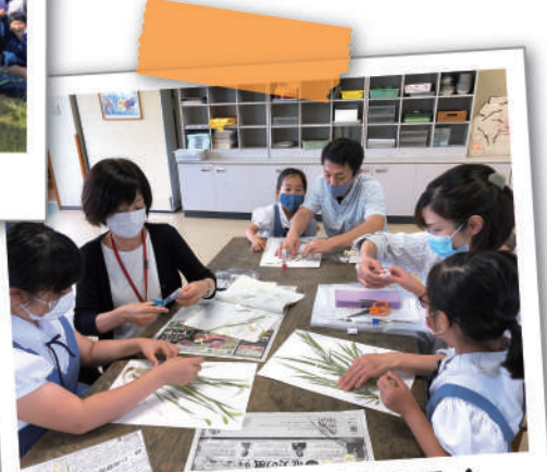
標本・自由研究講習会