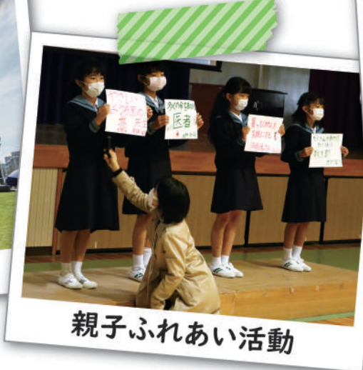
親子ふれあい活動